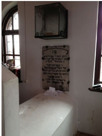
מצבת המגיד ממעזריטש

"לנו בבית יש כמה וכמה שלחנות", ענה הגביר, "ויש מפות נאות שמכסות את השלחנות, וסביב כל שלחן כמה וכמה