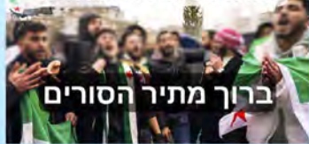
ברוך מתיר הסורים

בניתוח יוצא דופן, הפרשן האיראני ברדיה נרשאבי מודה כי תוך 14 חודשים הצליחו להביס אסטרטגיה איראנית שנבנתה במשך 45 שנה במזרח התיכון