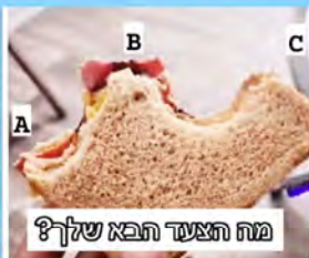
מה הצעד הבא שלך?

מתוך המבחן המסכם לפרמדיקים במד"א: 6. מה יקרה לכף רגל שאינה מקבלת דם לאורך זמן? נמק.