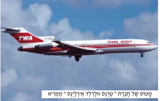
מטוס של חברת "טרנס וולרלד אירליינס" ממריא