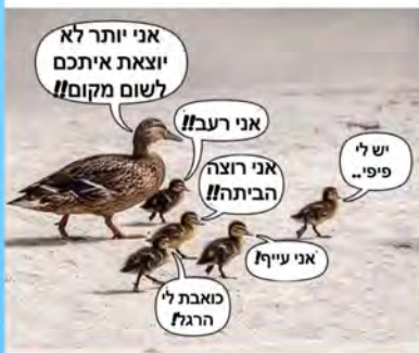
דיקטטורים גומרים רע, כדאי לזכור את זה

האמת שרציתי לומר תודה לשומר בקניון, על השמירה, ועל תחושת הביטחון שהוא משרה, אבל לא רציתי להעיר אותו בשביל זה.