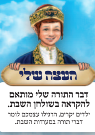
הנצה שלי דבר התורה שלי מותאם להקראה בשולחן השבת. לידים יקרים, הרגילו עצמכם לומר דברי תורה בסעודות השבת.