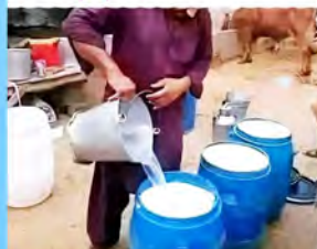
איש צנוע שוטף את החלב לפני מכירתו ללקוחות

מתוך המבחן המסכם לפרמדיקים במד"א: 6. מה יקרה לכף רגל שאינה מקבלת דם לאורך זמן? נמק.