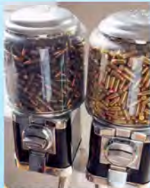
בקרוב בקיסקים נבחרים בסוריה

פרסום ראשון: בכניסה לאתר החרמון הסורי כבר עומדים שני ישראלים שדורשים 150 שקל לכניסה בלי ציוד סקי ובלי רכבל